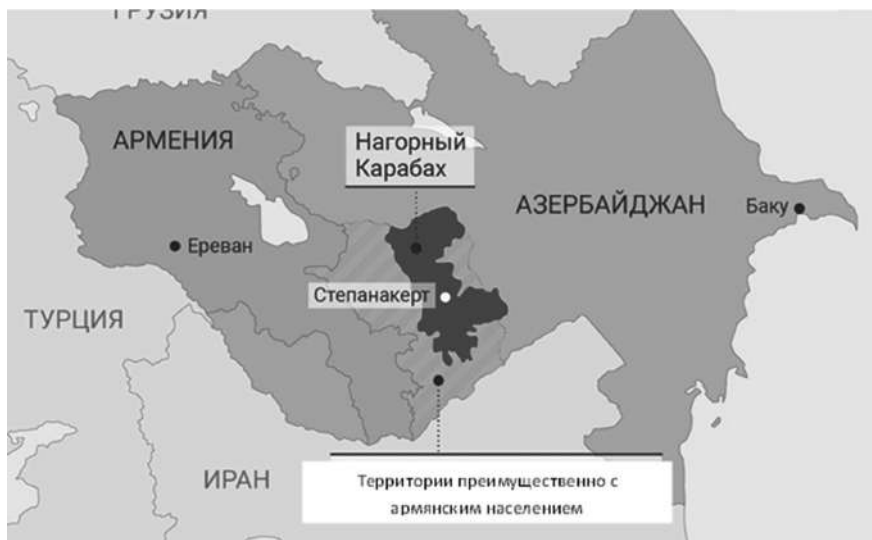
Рис. 1. Спорные территории в НКАО Азербайджана, (1991)

Рост национального самосознания малых народов привел к активным деструктивным процессам в республиках бывшего Советского Союза (Россия также была втянута в этот процесс). Титульные нации получили свою государственность и суверенитет, и стали неотступно реализовывать политику вытеснения малых народов со своих территорий, их исторической родины, что вызвало ответную реакцию со стороны национальных меньшинств. 20 февраля 1988 г. было положено начало активным протестам среди населения Нагорно-Карабахской Автономной области (НКАО) за отделение ряда районов от Баку (рис. 1).